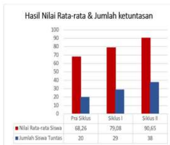
Diagram 2 Persentase Tingkat Ketuntasan Siswa