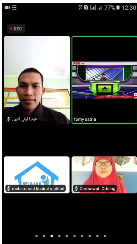
Gambar 2. Webinar PBG Kudus Tingkat Nasional (Pengembangan Sistem Penilaian Berbasis Game 16 Februari 2021)

Dengan mengikuti berbagai webinar, pelatihan dan workshosp diharapkan guru PAI mampu mengambil ilmu dan manfaat khususnya untuk proses pembelajaran saat ini, terlebih pembelajaran sistem daring. Jika guru PAI mengajar menggunakan jaringan internet dan aplikasi, guru harus mampu menguasai berbagai aplikasi yang digunakan seperti google meet , google classroom , zoom meeting , whatsapp , kahoot , quizizz , dan sejenisnya.